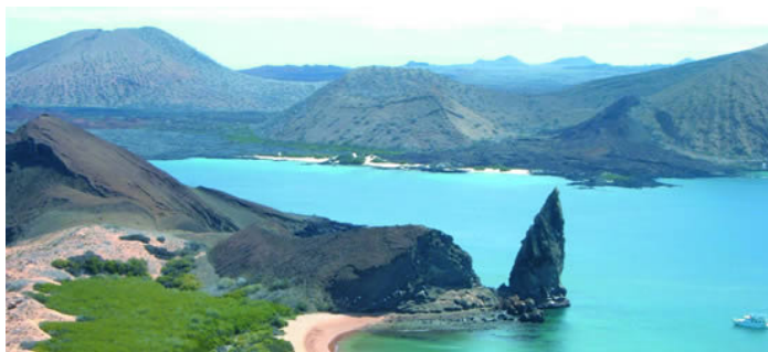
camera doppia in albergo di prima classe, trasporto turistico multilingue, crociera 4gg/3nts Galapagos; La quota non comprende, tra l'altro, voli internazionali Italia/Ecuador/Italia e relative tasse aeroportuali,