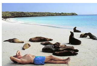
tassa d'ingresso alle Galapagos.

La quota comprende, tra l'altro, voli interni Ecuador/Galapagos/Ecuador, pernottamento in